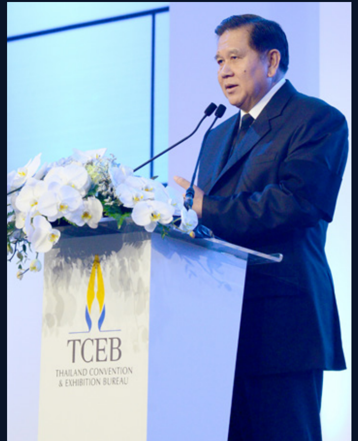
General Tanasak Patimapragon Deputy Prime Ministers