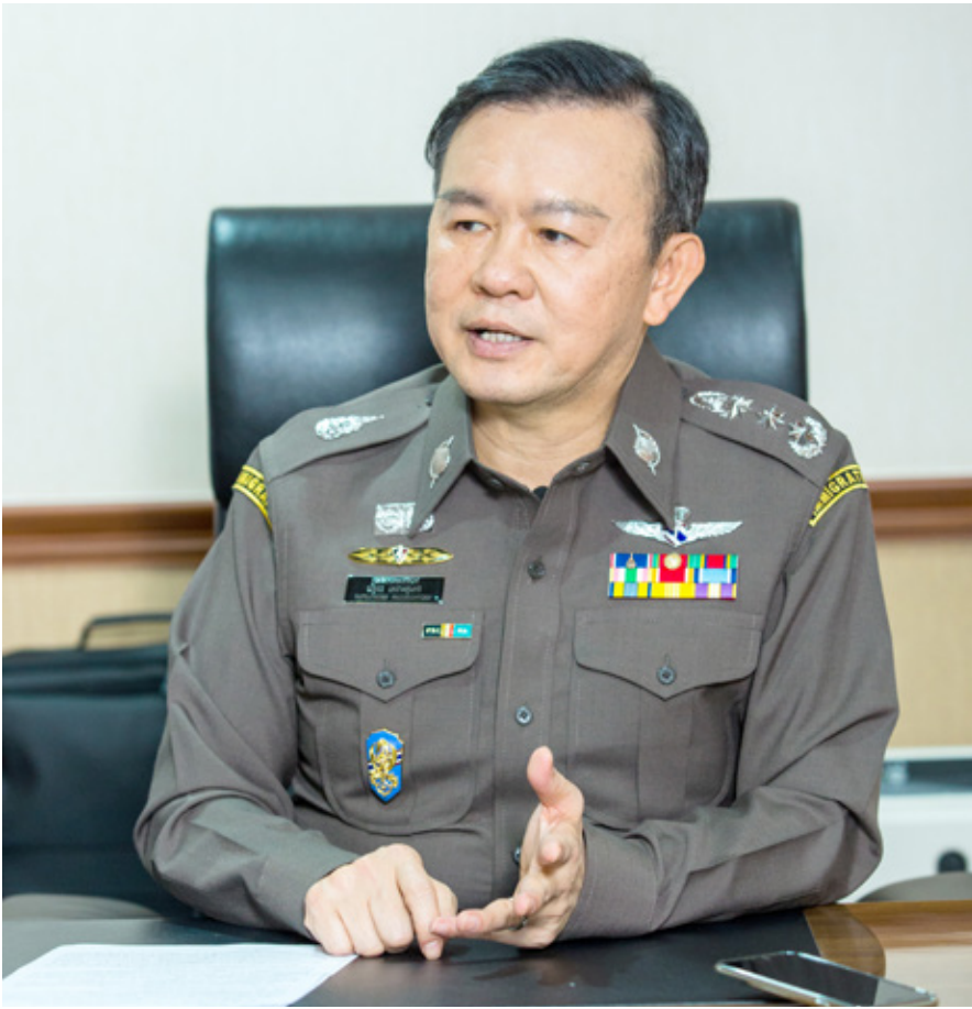
Pol. Lt. Gen. Nathathorn Prousoontorn Commissioner of the Immigration Bureau