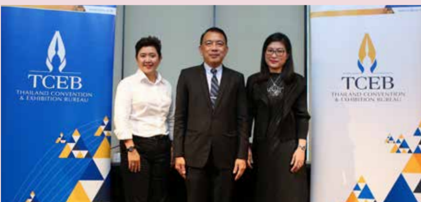
รุดตลาดการประชุมปี 2559 ส่งเสริมกิจกรรมการตลาดผ่าน 3 แคมเปญหลัก

TCEB, in collaboration with the Dental Association of Thailand (DAT) under Royal Patronage, hosted Thailand’s first FDI Bangkok 2015, at BITEC Bangna from 22-25 September 2015. Taking “Dental of the 21st Century” as its theme, the event welcomed over 10,000 participants and generated over 800 million baht in revenue. Consistent with the objectives of “Thailand CONNECT The World”, the event strengthened Thailand’s status as a premier destination for international business conventions. FDI was one of the biggest events TCEB hosted in 2015 and was key to advancing its aim to drive the international meeting industry to meet its targets of 338,110 MICE travellers and 37.8 billion baht in revenue this year. The event also helped to spur expansion and development of the Thai MICE industry overall with a number of 1,036,300 MICE travellers, coming to Thailand, raising the national revenue of around 106,780 million baht.