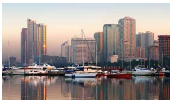
The process of building infrastructure and facilities to accommodate MICE activities is on-going and increasingly impressive.

ปีงบประมาณ 2557 นักเดินทางกลุ่มไมซ์จากประเทศฟิลิปปินส์ เดินทางมาเยือนประเทศไทยเป็นลำดับที่ 18 ของนักเดินทางกลุ่มไมซ์จากทั่วโลก คิดเป็นจำนวน 11,197 คน สร้างรายได้ 984.28 ล้านบาท