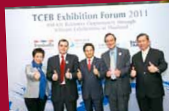
TCEB Exhibition Forum 2011