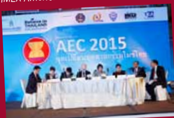
Seminar: AEC 2015