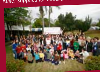
Post-flood clean-up in Ayutthaya