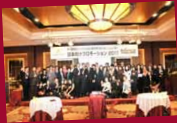
Japan road show 2011