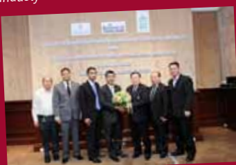
Cooperation with Customs Department to Facilitate Import of Exhibitions