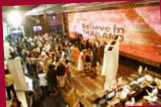
Connection Plus 2011: Hua Hin