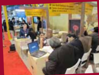
IMEX America 2011