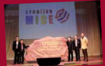
Creative MICE: Khon Kaen, Ubon Ratchathani