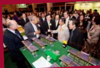
Business Symposium: Opportunities in 5 Key Business Sectors in Thailand