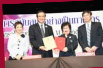
MOU to host World Philatelic Exhibition 2013