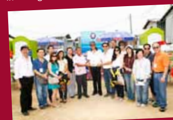
Relief supplies for flood evacuees in Krabi