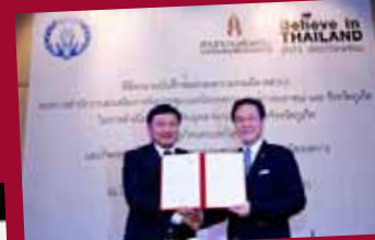
MICE City: Phuket