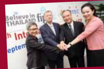
Bid won to host International Congress FIP 2014