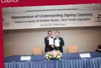
MOU: TCEB and Seoul Tourism Organization