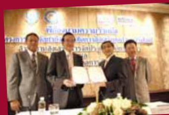
MOU: TCEB and Thai Chamber of Commerce