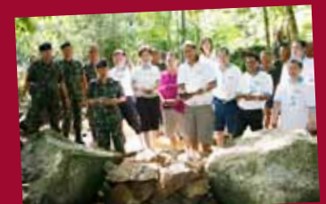
Building weir on Samui island