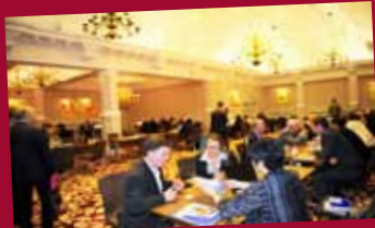
London road show 2011