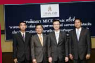
MICE Clinic: Taxation for Promoting MICE Industry