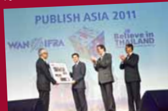
Publish Asia 2011