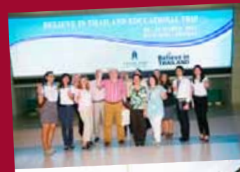
Believe in Thailand Education trip: Bangkok and Phuket