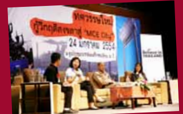
MICE City: Songkla