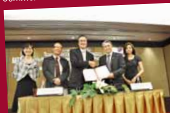
MOU: TCEB and Bangkok University