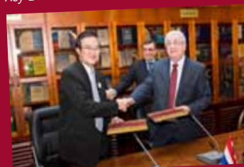
MOU: TCEB and Russian-Thai Business Council