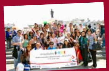
D-MICE campaign+Fam trips