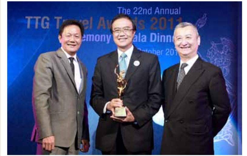
TCEB wins the TTG Travel Awards 2011 under the Best Convention and Exhibition Bureau

The global economic uncertainty and the flood disaster in the last quarter of 2011 badly hit both the domestic and international MICE market and saw a decline in the number of MICE travelers. TCEB has thus been forced to gear up and adjust its marketing strategy and operating plan. The bureau has also mobilized the opinions of concerned private sector organizations to revise the MICE Industry Development Plan 2012.