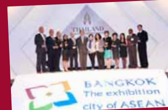
Bangkok: Exhibition City of ASEAN