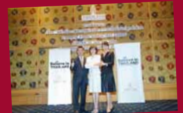
ISO 22000 Food Safety Standard