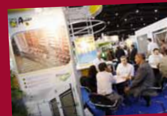
VIV Asia 2011