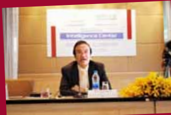
Developing MICE Intelligence Center to enhance Thai MICE capability