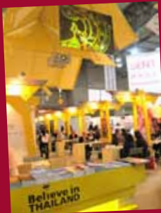
EIBTM Barcelona, Spain