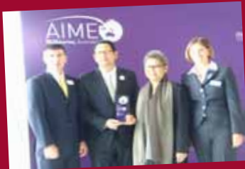
AIME 2011 Australia