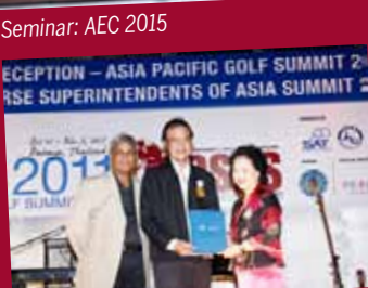
2011 Asia-Pacific Golf Summit