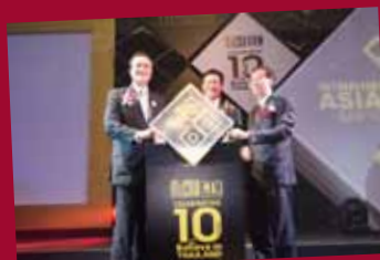
19th IT&CMA and 14th CTW Asia Pacific