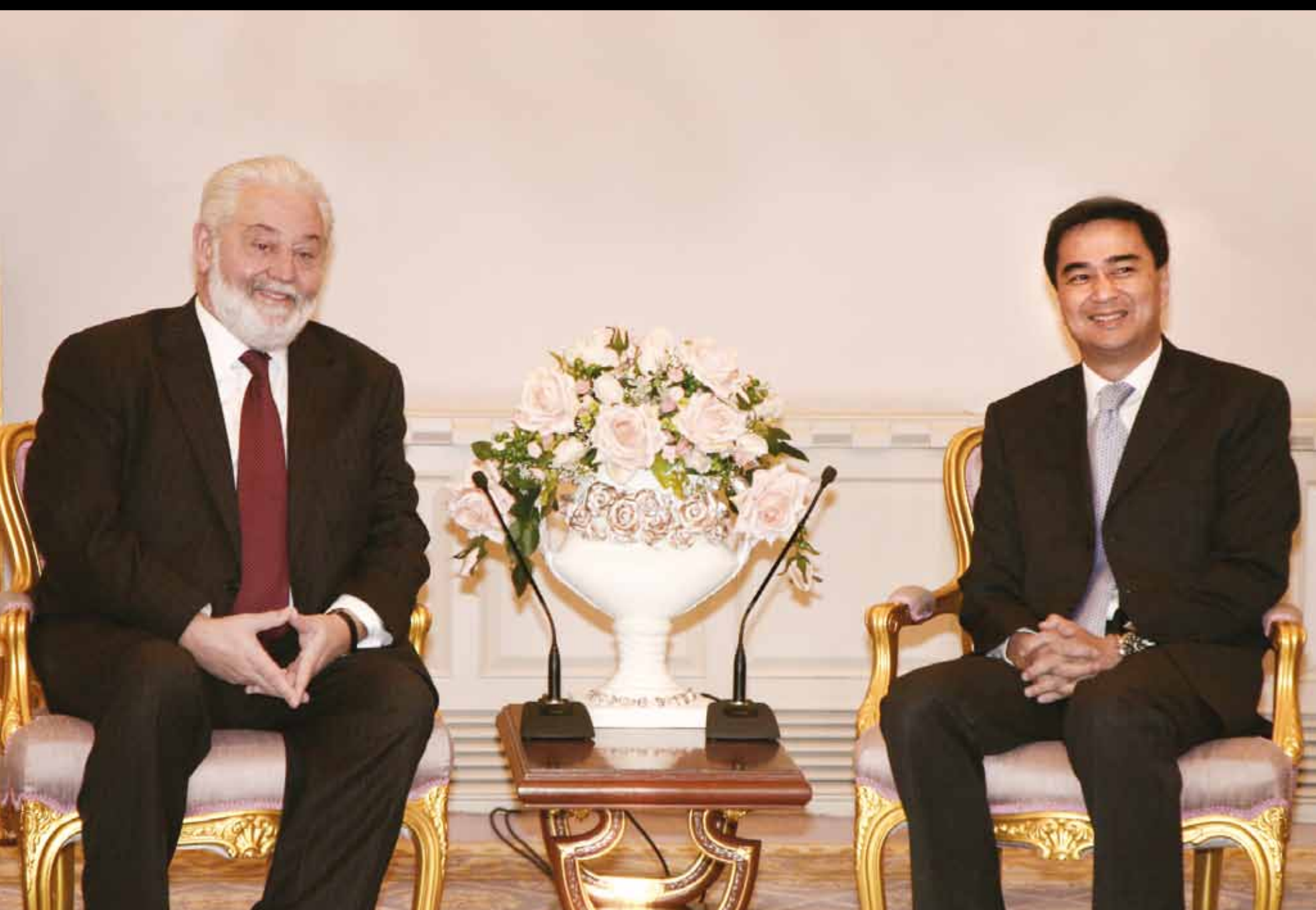
H.E. Mr. Vicente Gonzalez Loscertales Secretary General of the Bureau International des Expositions: BIE meets the Prime Minister Abhisit Vejjajiva at Santi Maitri Building, Royal Thai Government House, during his official visit in Thailand.

รัฐและเอกชนผนึกกำลังยืนยัน ความพร้อมต่อเลขาธิการ สำนักงานมหกรรมโลก โชว์วิสัยทัศน์และศักยภาพของไทยใน 10 ปีข้างหน้า